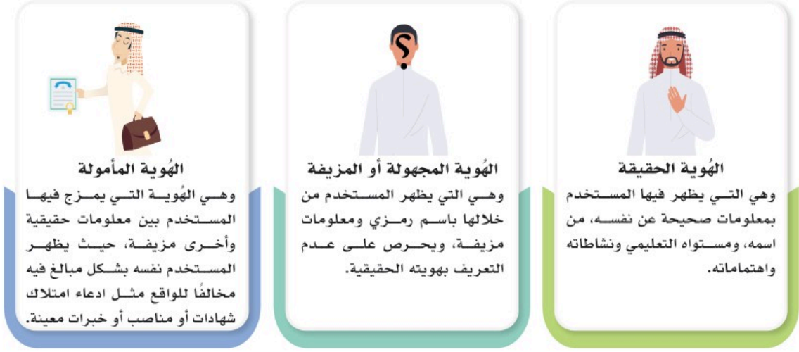
شكل (2-2): أشكال الهوية الرقمية

يوضح الشكل (2-2) أشكال الهوية الرقمية حيث يختلف شكل الهوية لدى مستخدمي شبكة الإنترنت ووسائل التواصل الاجتماعي في العالم الرقمي، ومنها: